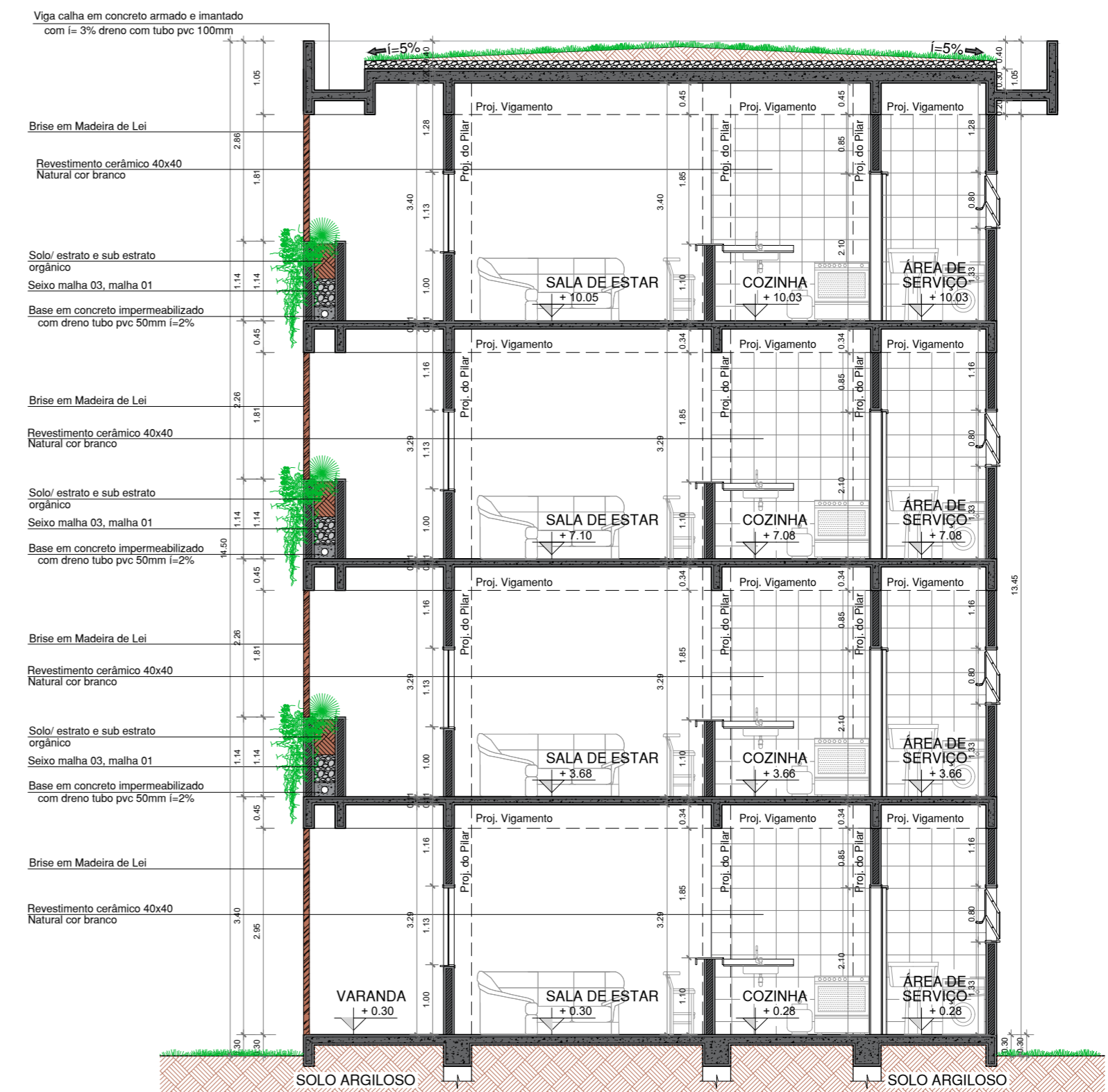
1/75 CORTE LONGITUDINAL - B' VISTA ALTIMÉTRICA