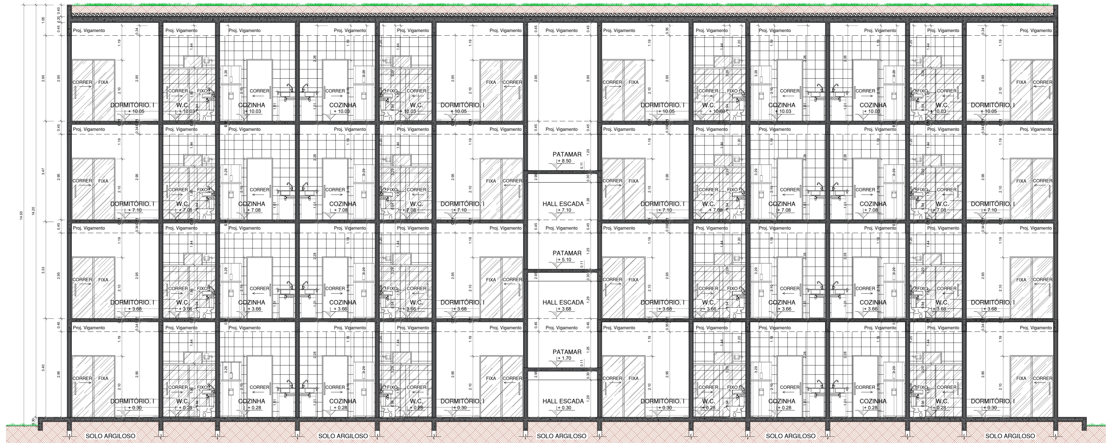
1/75 CORTE LATITUDINAL - C' VISTA ALTIMÉTRICA