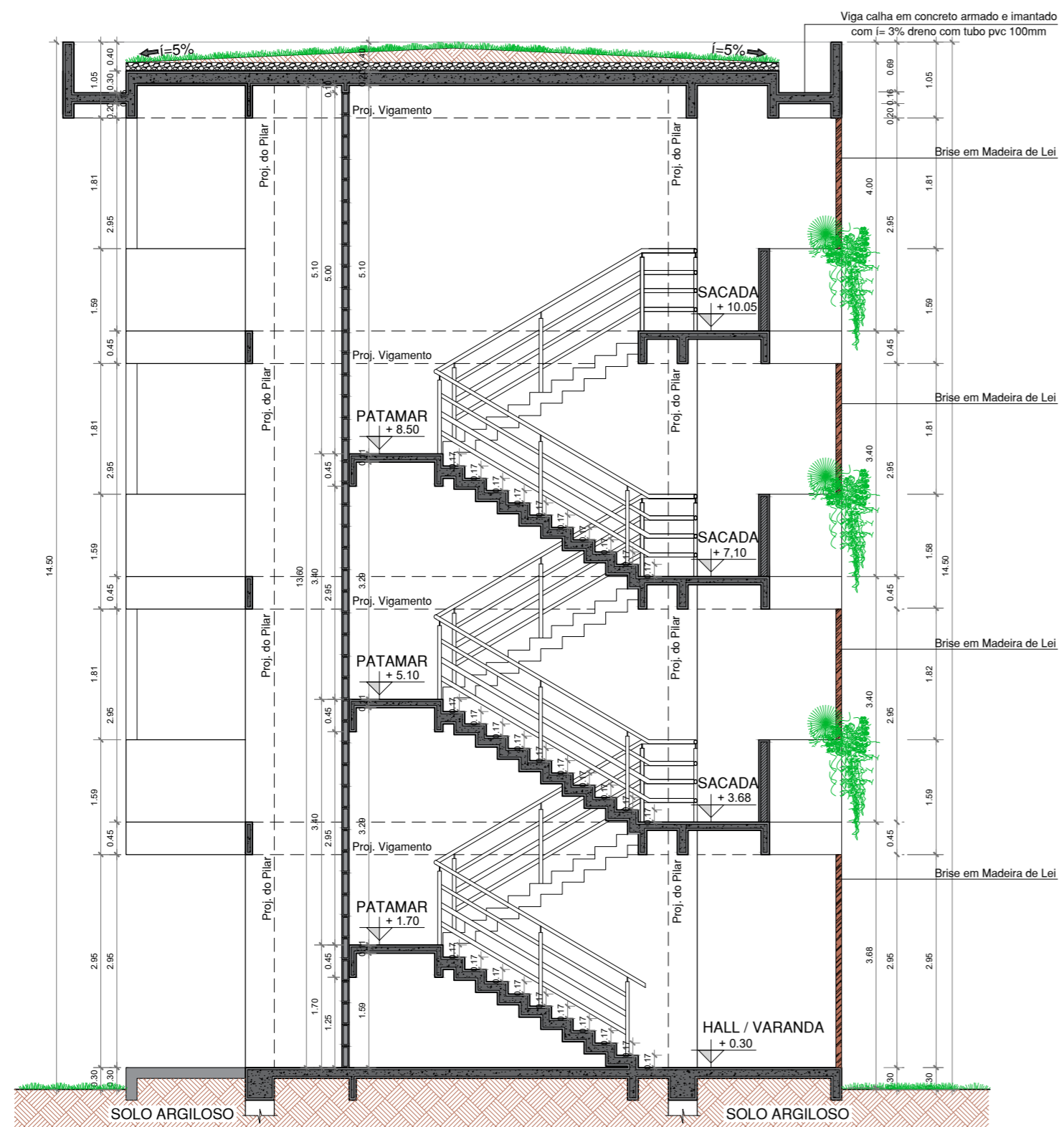
1/75 CORTE LONGITUDINAL - A' VISTA ALTIMÉTRICA