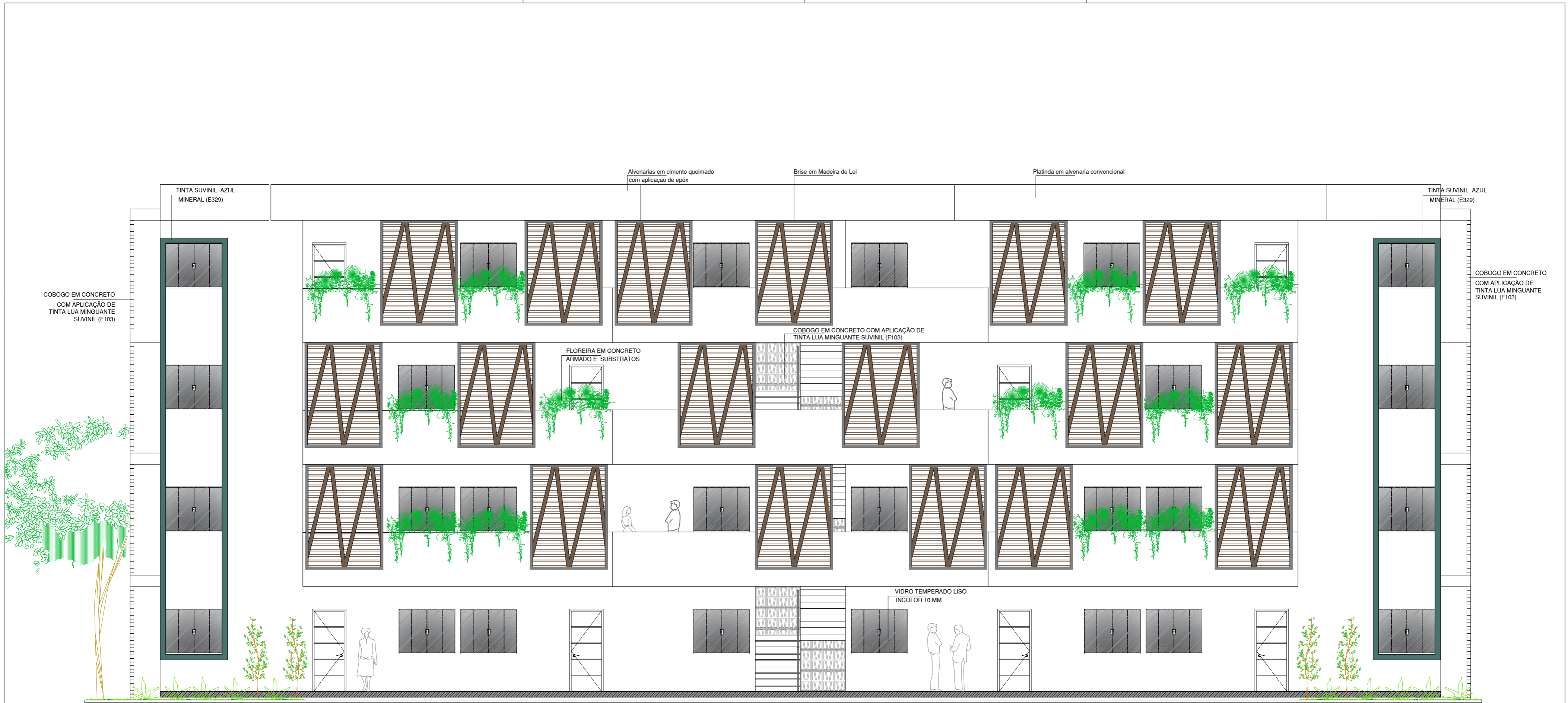
FACHADA FRONTAL HABITAÇÃO MULTIFAMILIAR