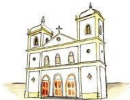
MEMORIAL RIO GRANDE DO SUL 1910

estudo é a cidade de Porto Alegre/RS, a arquitetura é uma das mais antigas do país e é possível acompanhar sua trajetória histórica por meio das fachadas e obras arquitetônicas da capital. No caderno são apresentados edifícios arquitetônicos do sec. XIX e começo do XX, com importância histórica e cultural para o Brasil, que são: Igreja Nossa Senhora das Dores – 1813; Paróquia Nossa Sra. Da Conceição – 1851; Palácio do Ministério Público – 1857; Teatro de São Pedro – 1858; Paço Municipal de Porto Alegre – 1898; Palácio Piratini – 1909; Memorial Rio Grande do Sul – 1910; Casa de Cultura Mario Quintana – 1916; Casa Parreira Machado – 1916; Solar da Travessa do Paraíso – 1920.