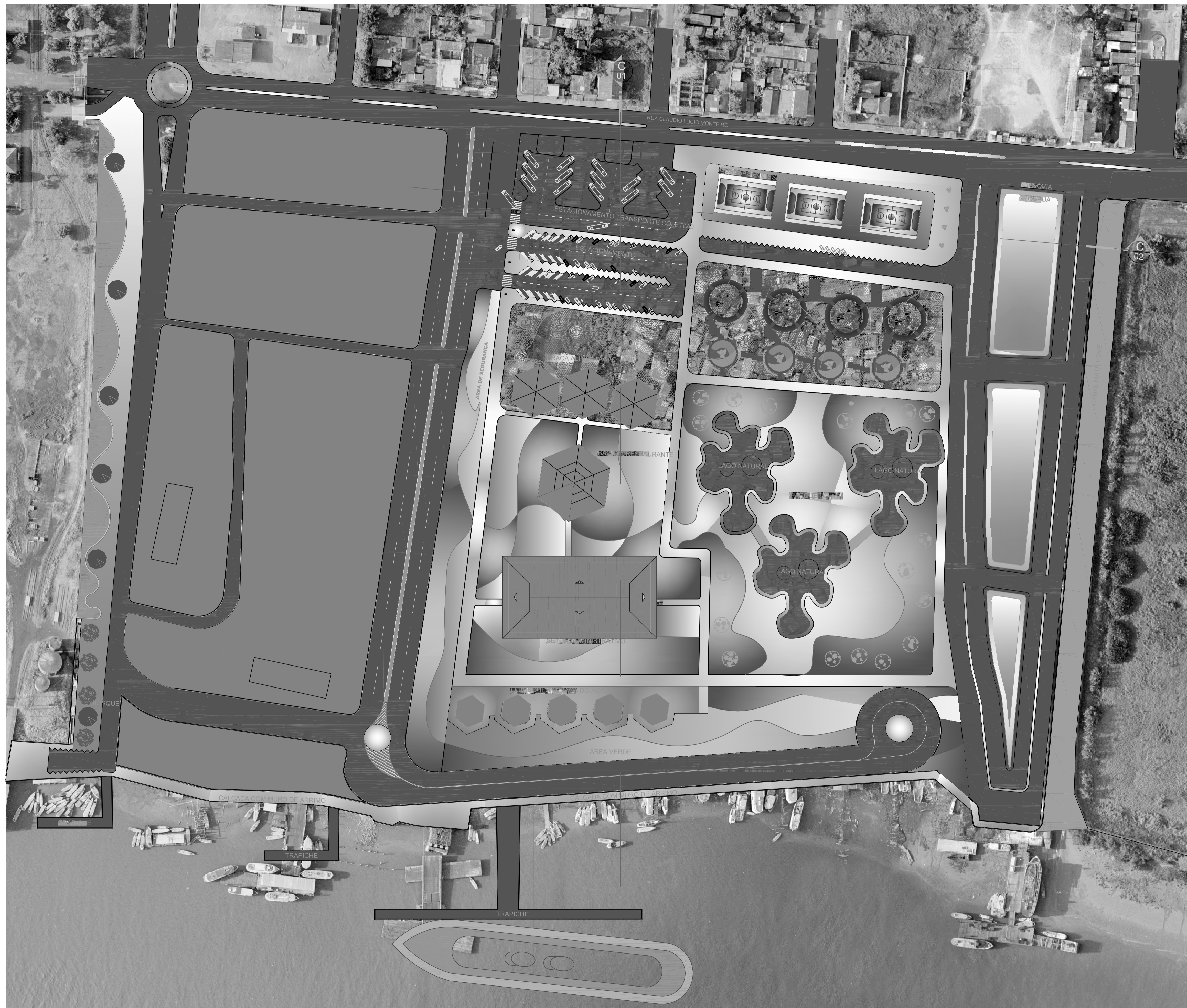
PLANTA BAIXA - IMPLANTAÇÃO ESCALA: 1/1250