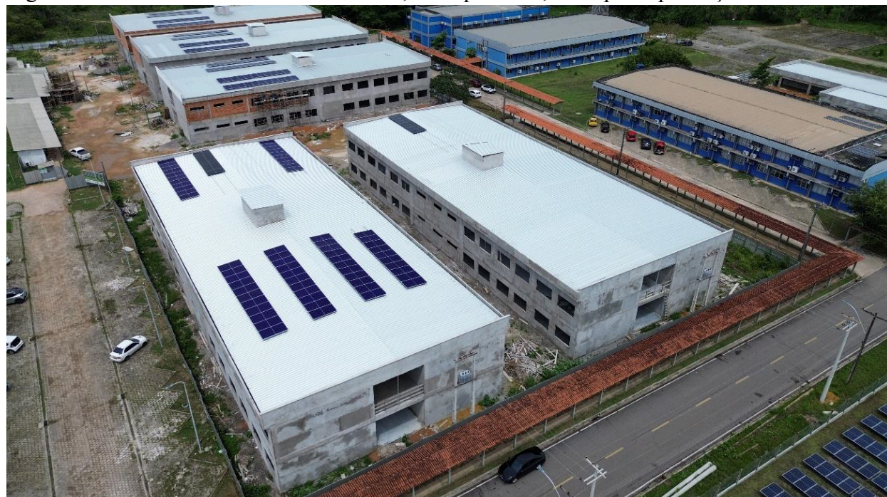
Imagem 2 – Geradores fotovoltaicos de 2x60,16kWp e 3x30,10kWp - implantação.