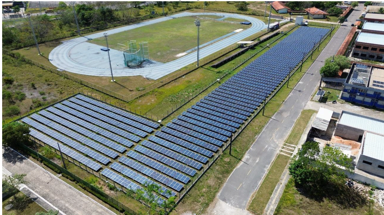
Imagem 1 – Gerador fotovoltaico de 554,4kWp - operação.