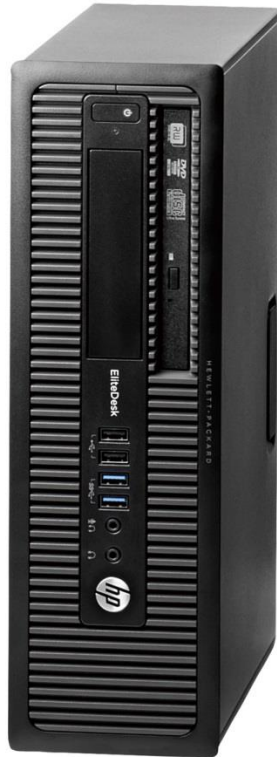
HP EliteDesk 800 G1 SF