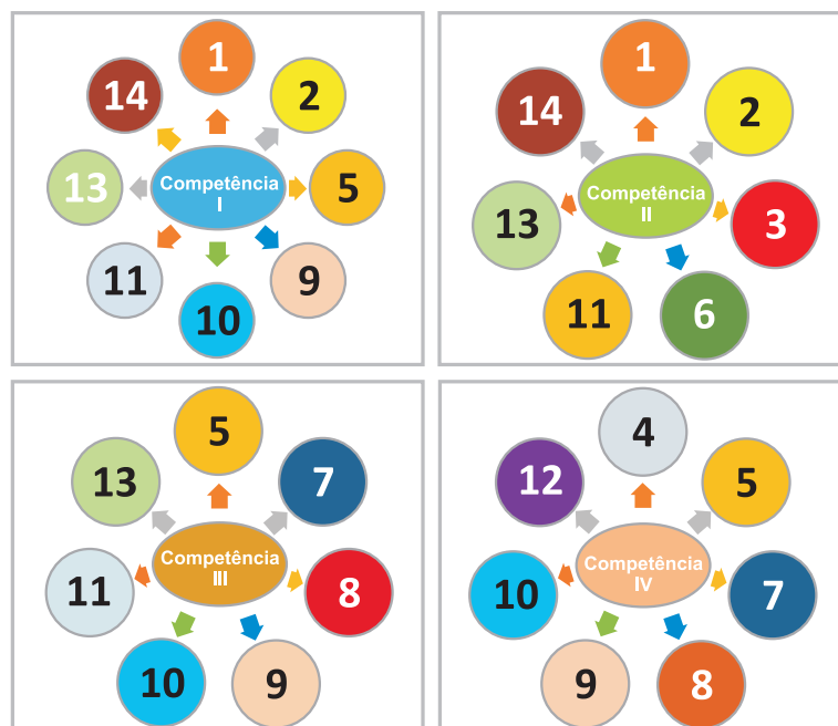
FIGURA 1 Representação gráfica da relação entre competências e habilidades para o 2º ano do curso de Medicina