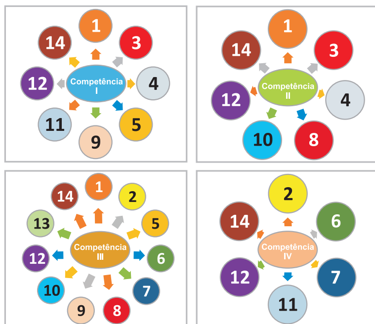
FIGURA 3 Representação gráfica da relação entre competências e habilidades para o 6º ano do curso de Medicina