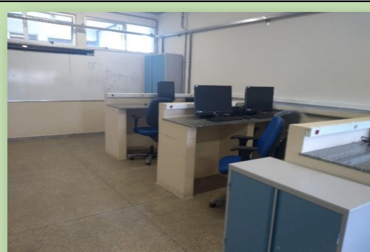
Foto 3 - Computadores