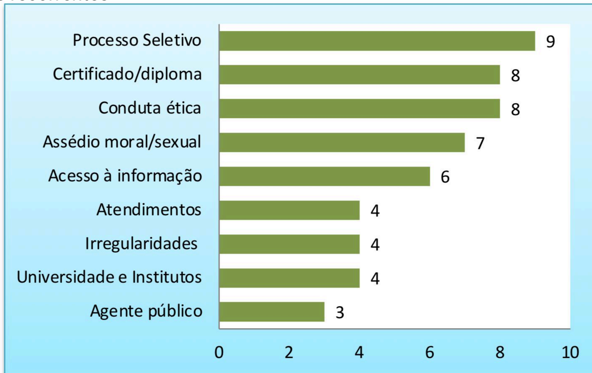
Gráfico 03: Temas recorrentes

Abaixo no gráfico 03, estão apresentados os assuntos mais demandados recebidos durante o período compreendido neste relatório, por meio do Fala.BR