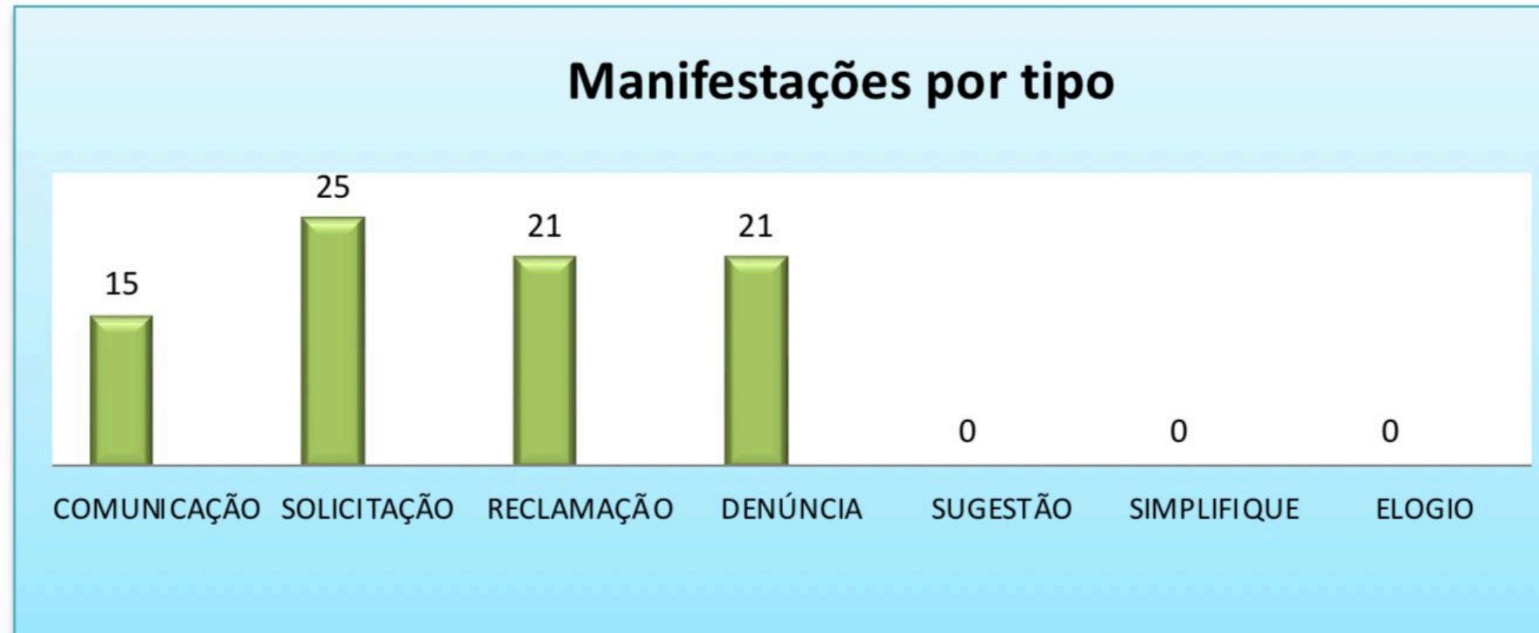
Gráfico 01: Tipos