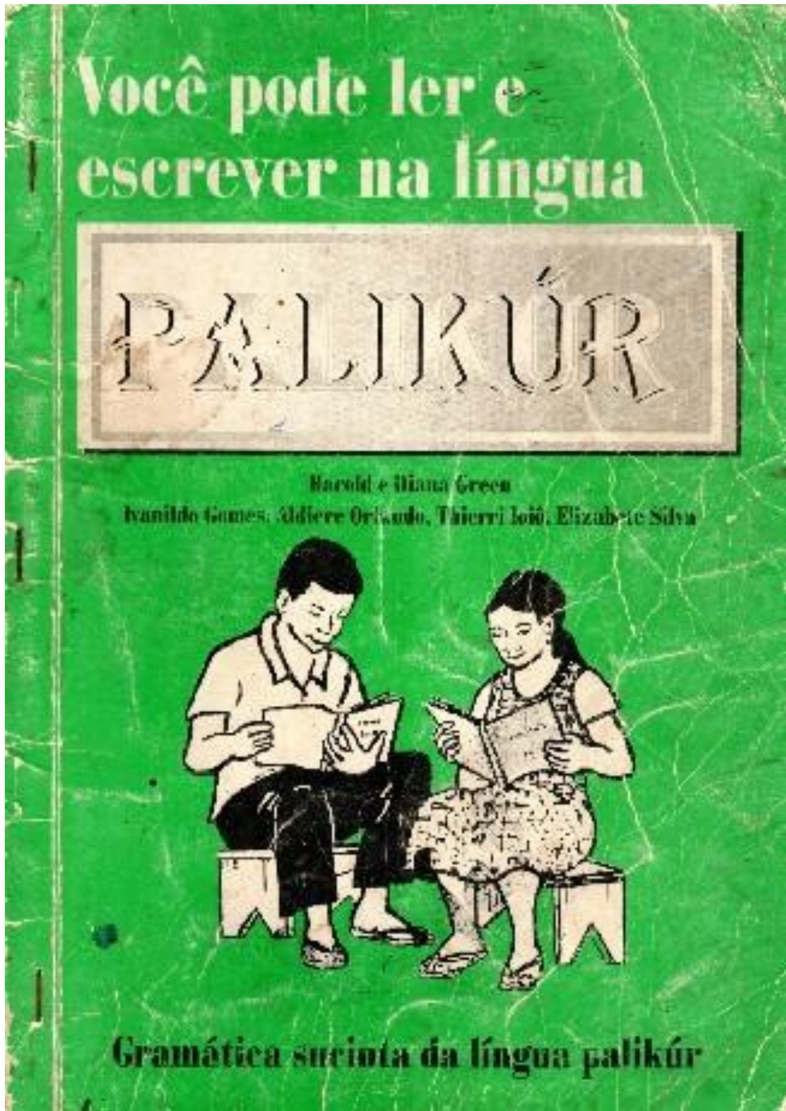
Figura 5 - Gramática sucinta na língua palikur “Você pode ler e escrever na língua Palikur, trabalho dos Missionários Green(1996) e seus informantes