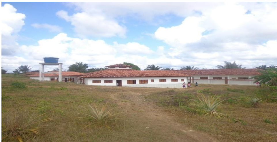
Figura 4 - Vista da Escola Indígena Estadual Moisés Iaparrá - 2ª estrutura.