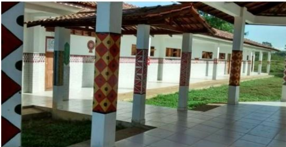
Figura 3 - Escola Indígena Estadual Moisés Iaparrá

Com o surto da pandemia do coronavírus (Covid-19) em 2020 as aulas pelo SOMEI tiveram que ser suspensas em todas as escolas-polo nas áreas indígenas de Oiapoque e só retornaram no início do ano de 2023. A suspensão das aulas limitou o desenvolvimento da pesquisa, particularmente na Escola Moisés Iaparrá, pois não foi possível aplicar os questionários para os alunos pre-selecionados, ou seja, da turma do 9º ano, como também para os seus professores no tempo oportuno.