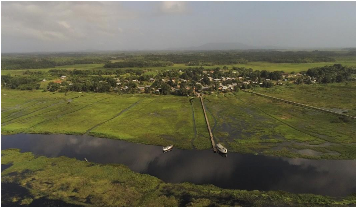
Figura 2 - Aldeia Kumenê vista aérea.

O povo indígena Palikur 1 -Arukwayene 2 , com aproximadamente 1825 pessoas (DSEI/AMP-2019), vive na Terra Indígena Uaçá, no rio Urucauá. Possui doze comunidades ao longo da margem direita e esquerda do rio Urucauá, fundadas e representadas pelos seus próprios membros que são líderes tradicionais, são elas: Flecha, Tipoca, Tawary, Amomni, Urubu, Mangue, Kumenê, Kuwikwit, Puwaytyeket, Kamuywa, Yanawa e Iwawka, sendo esta última fica ao sul da região Uaçá, na margem da BR-156 no km 80, trecho que corta a TI Uaçá. Este povo mantém a sua língua materna que é Palikur 3 do tronco linguístico Arawak até os dias atuais.