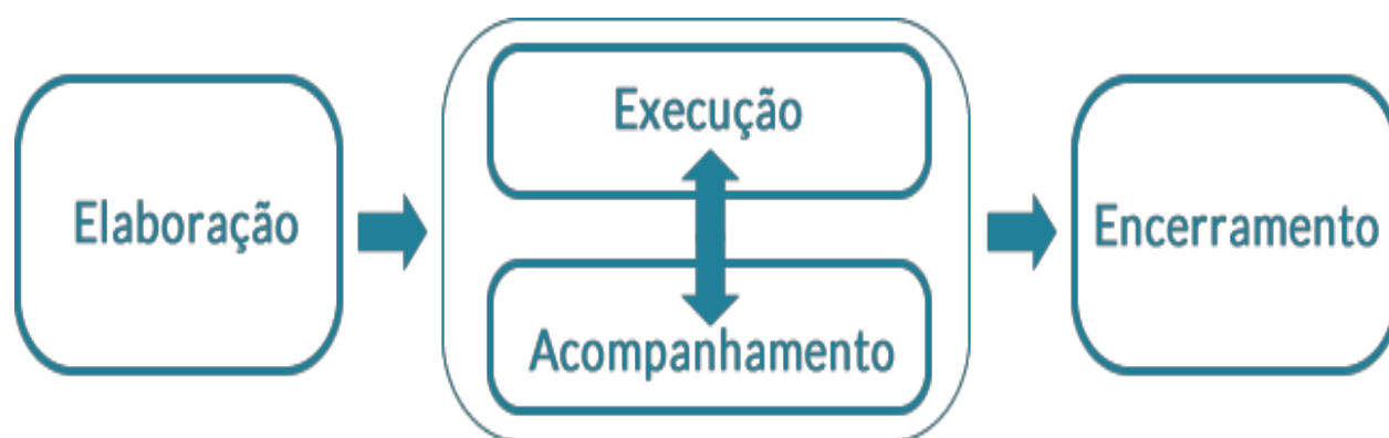
Figura 1 – Fases do PDU

O processo do PDU é composto por três fases – Elaboração, Execução/Acompanhamento e Encerramento – tal como descrito na Figura a seguir: