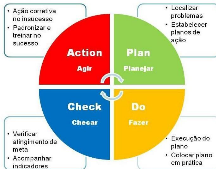
Figura 3 – Ciclo PDCA

As etapas do PDCA são realizadas em ciclos, ou seja, a última etapa se conecta com a primeira e assim continuamente até que o resultado esperado com a adoção do ciclo seja atingido. A figura a seguir é ilustrativa das etapas em referência.