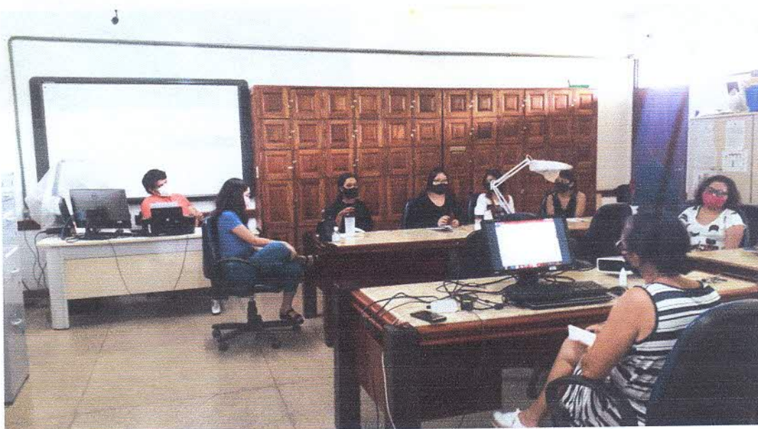
Estudos de temas sobre memória, em 19.05.2021

Obs.: Informo ainda que conforme Resolução 005/2021 - CONSU/UNIFAP, de 26 de fevereiro de 2021 , as atividades do projeto ocorrerão de forma híbrida (ou seja, presencial e EaD).