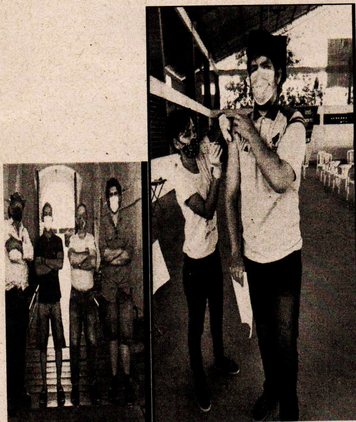
Foto: 01 – evento projeto 58/2020 – Fortaleza de São de Macapá