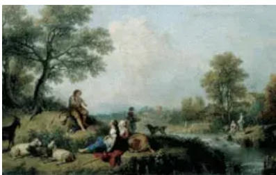
(Francesco Zuccarelli. Cena pastoral.)