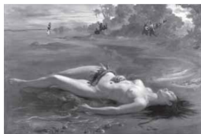
MEIRELLES, V. Moema . Óleo sobre tela, 129 cm x 190 cm. Masp, São Paulo, 1866.

Nessa obra, que retrata uma cena de Caramuru , célebre poema épico brasileiro, a filiação à estética romântica manifesta-se na