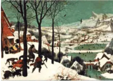
(Pieter Brugel. Os caçadores na neve.)

1) Das pinturas reproduzidas nas alternativas, aquela que remete ao ideário do Barroco é: