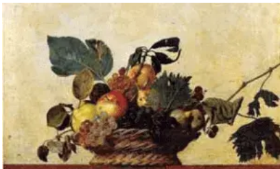
(Michelangelo Caravaggio. Cesta de frutas.)