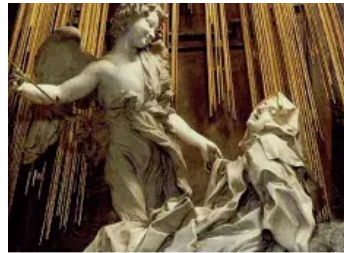
Êxtase de Santa Teresa, Bernini.

Entre os artistas do Barroco italiano, Bernini (1598-1680), sem dúvida, é o mais importante e completo, pois foi arquiteto, urbanista, escultor, decorador e pintor. A obra acima, de Bernini, revela características da escultura barroca como