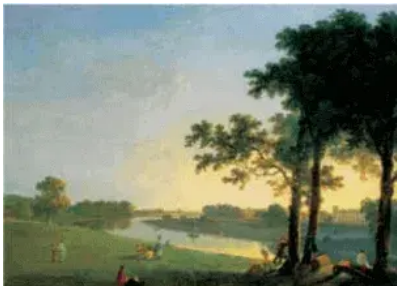
(Richard Wilson. Vista da Casa Syon.)