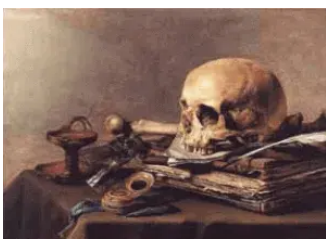
(Pieter Claesz. Vanitas.)