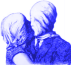
René Magritte, representante do Surrealismo.