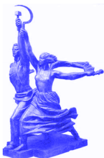
MÍKHINA, V. Operário e mulher kolkosiana . Aço inoxidável, 24,5 m. Moscou, 1937. Disponível em: http://fotobloggu.hautetort.com . Acesso em: 7 maio 2013.

Essa escultura foi produzida durante o período da ditadura stalinista, na ex-União Soviética, e representa o(a)