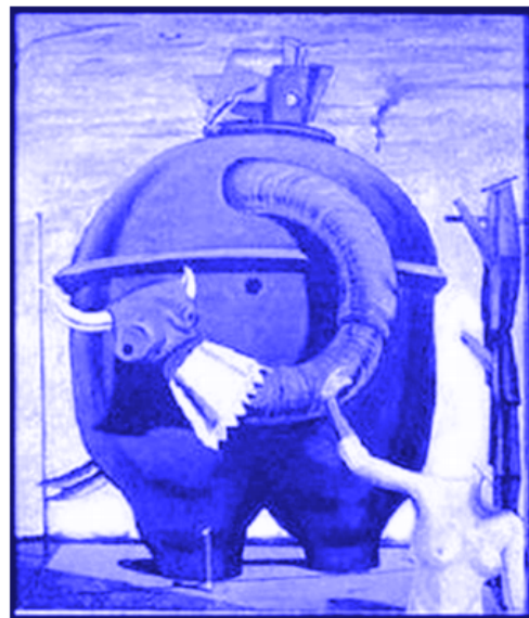
ERNEST, M. O gigante acéfalo. Disponível em: www.historiadaarte.com.br . Acesso em: 26 jan. 2012.

A perplexidade causada pela catástrofe da Primeira Guerra Mundial fez surgir um movimento de vanguarda denominado Dadaísmo, que rejeitava os valores tradicionais e rompia com a estética clássica. A imagem da obra O gigante acéfalo