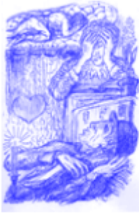
Alfred Kubin, representante do Expressionismo.