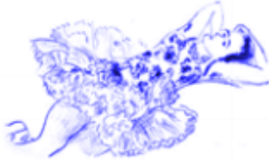
Henri Matisse, representante do Fauvismo.