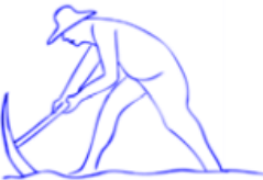
Diego Rivera, representante do Muralismo.