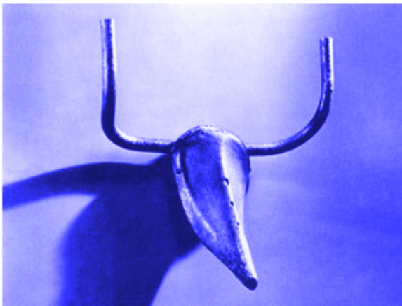
PICASSO, P. Cabeça de touro . Bronze, 33,5 cm x 43,5 cm x 19 cm. Musée Picasso, Paris. França, 1945.

JANSON, H. W. Iniciação à história da arte . São Paulo: Martins Fontes, 1988.