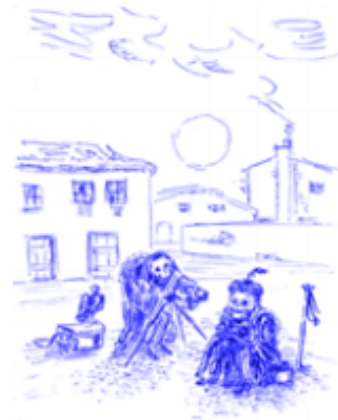
GOELDI, O. Sem título . Bico de pena, 29,4 x 24 cm. Coleção Ary Ferreira Macedo, circa 1940.

Disponível em: https://revistacontemporartes.blogspot.com.br . Acesso em: 10 dez. 2012.