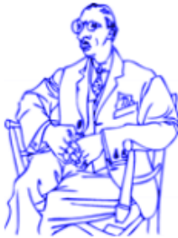
Pablo Picasso, representante do Cubismo.