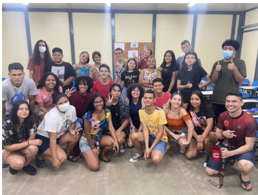
SEMANA DO CALOURO 2022