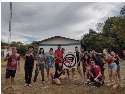
TROTE DOS CALOUROS 2022