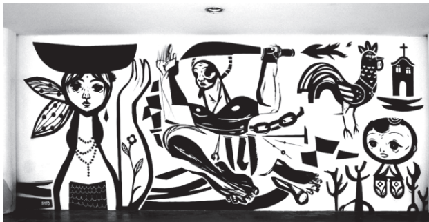
SPETO. Grafite . Museu Afro Brasil, 2009.