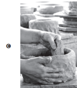
Ofício das panelleiras de Goiabeiras (ES)

“Eu não estou doente... Eu estou despedaçada... Mas me sinto feliz por estar viva enquanto eu puder pintar.”