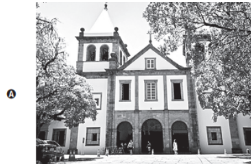
Mosteiro de São Bento (RJ)

Entre os bens que compõem o patrimônio nacional, o que pertence à mesma categoria citada no texto está representado em: