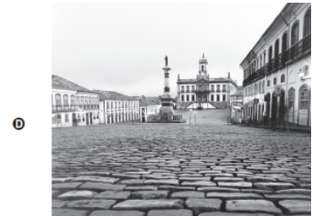
Conjunto arquitetônico e urbanístico da cidade de Ouro Preto (MG)