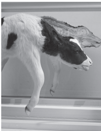
HIRST, D. Mother and Child . Bezerro dividido em duas partes: 1029 x 1689 x 625mm, 1993 (detalhe). Vidro, aço pintado, silicone, acrílico, monofilamento, aço inoxidável, bezerro e solução de formaldeído.