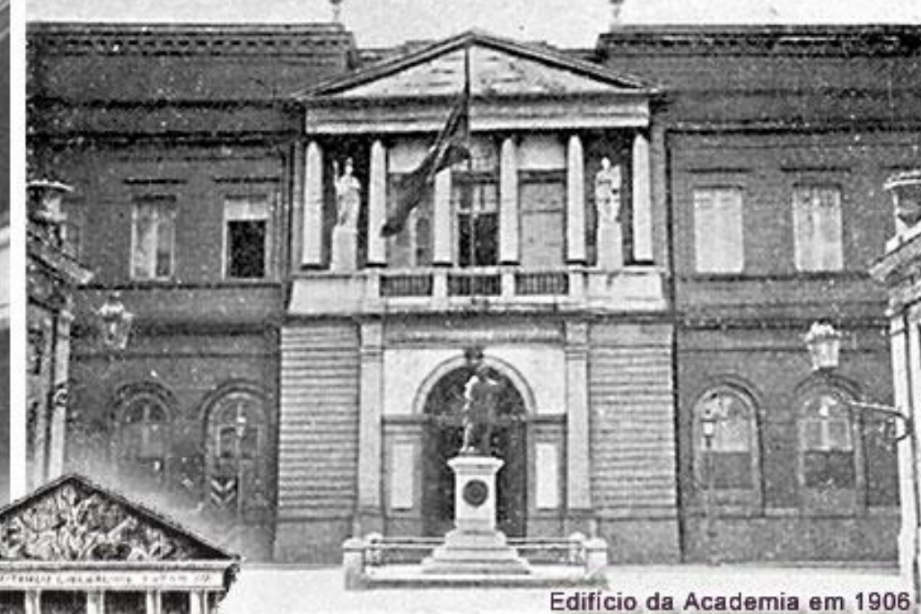
Edifício da Academia em 1906

Academia Real de Belas Artes Arte e montagem: JR | www.riodejaneiroaqui.com