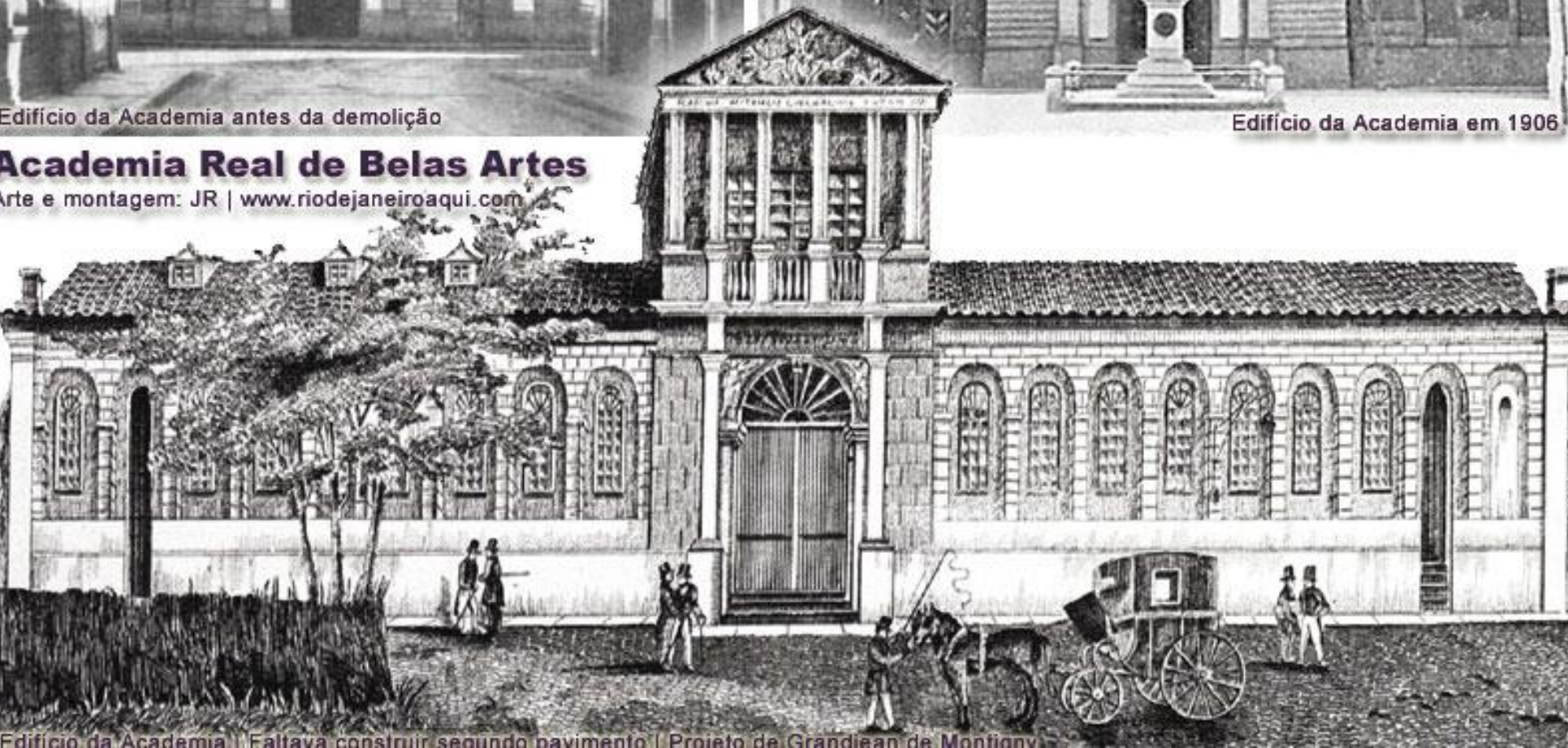
Edifício da Academia | Faltava construir segundo pavimento | Projeto de Grandjean de Montigny

Academia Real de Belas Artes Arte e montagem: JR | www.riodejaneiroaqui.com