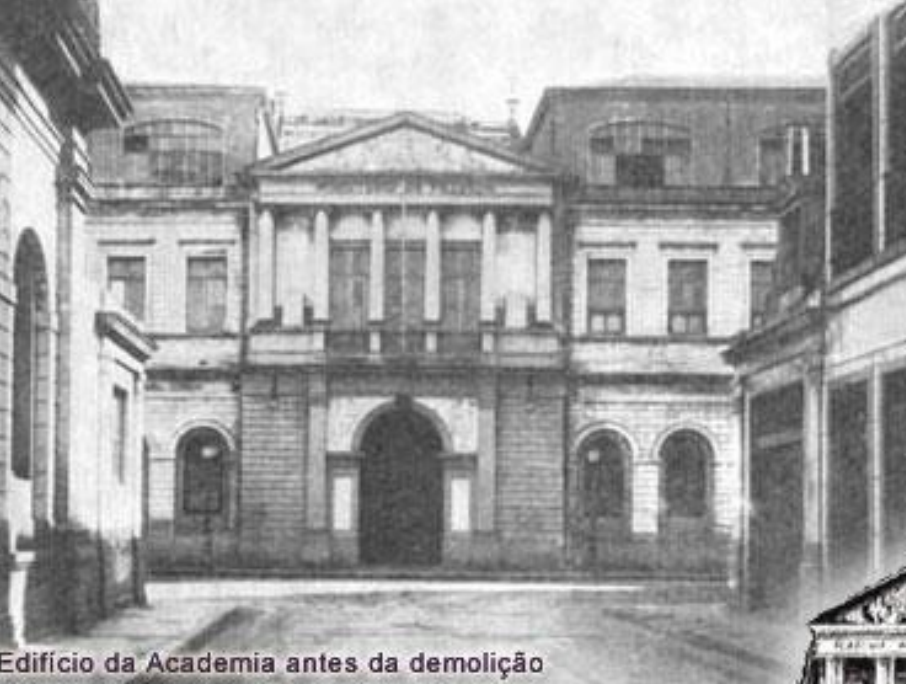
Edifício da Academia antes da demolição