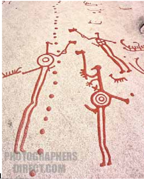
Fig. 1: Guerreiros portando escudos com motivos solares: roda solar e círculos concêntricos. Além do óbvio caráter marcial, o conjunto denota um sentido de virilidade e fertilidade aos elementos masculinos. 8 Bohuslan, Suécia, Idade do Bronze.