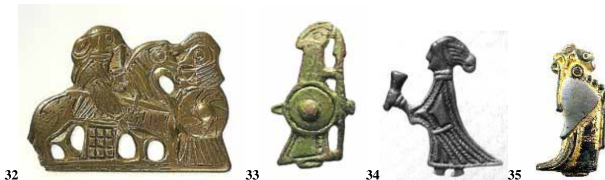
Fig. 32: Pingente com duas valquírias, Tissø, Dinamarca, séc. X. Fonte: Glot, 2004: 29. Fig. 33: Pingente de valquíria, Cawthorne, Inglaterra, séc. X. Fonte: Hall, 2007: 107. Fig. 34: Pingente de valquíria levando hidromel, Suécia, séc. X. Fonte: Graham-Campbell, 2001: 183. Fig. 35: Pingente de valquíria, Suécia, séc. X. Fonte: Graham-Campbell, 2001: 114.

Em alguns escassos pingentes, porém, as valquírias surgem como nas fontes literárias: armadas com cotas de malha, lanças, escudos e espadas (figuras 32 e 33). Muitas destas figuras foram encontradas em tumbas femininas, demonstrando que as mulheres também tinham fortes relações com os cultos odínicos e o seiðr (Price, 2004: 118).