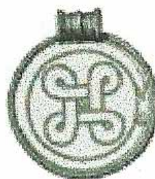
Fig. 20: Estela de Hablingbo Havor II , Gotland, Suécia, séc. VII.