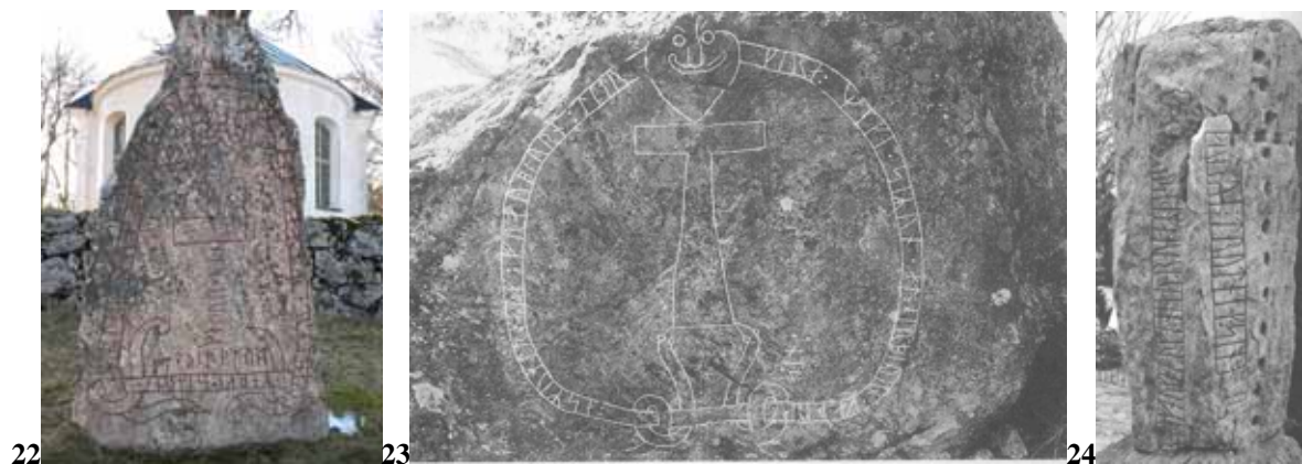
Fig. 22: Pedra rúnica de Stenkvista (Sö 111), Suécia, séc. XI.

Outras conexões relacionam Thor com o xamanismo, os ferreiros e os cultos de guerreiros, como em Horagales, na área lapônica, cujos tambores mostravam uma figura masculina com um martelo ou suástica (Lindow, 1994: 500). Desta maneira, não há como desvincular mjöllnir de ser tanto um objeto heróico, como mágico e protetor. 33