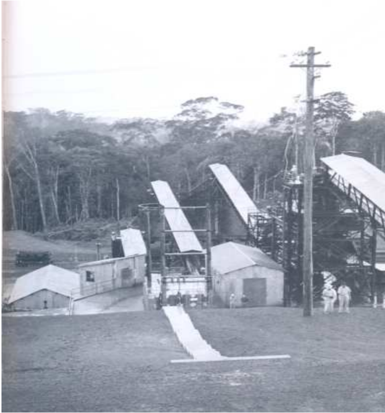
Figura 3: Instalações iniciais da ICOMI na Amazônia