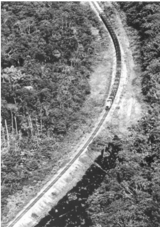
Figura 4: Ferrovia que transportava os minérios de Serra do Navio para Santana