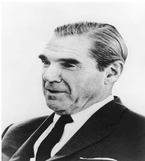
Figura 1: Daniel Ludwig

A exploração mineral no Amapá, considerada a primeira na Amazônia, foi articulada na época em que o estado ainda era Território Federal, pelo empresário Augusto Trajano de Azevedo Antunes, dono da Indústria e Comércio de Mineração S/A (ICOMI), pertencente ao grupo da Companhia Auxiliar de Empresas de Mineração (CAEMI), parceiro nacional da empresa estadunidense de Daniel Ludwig, a Bethlehem Steel Company, além do governador do Território, Janary Gentil Nunes.