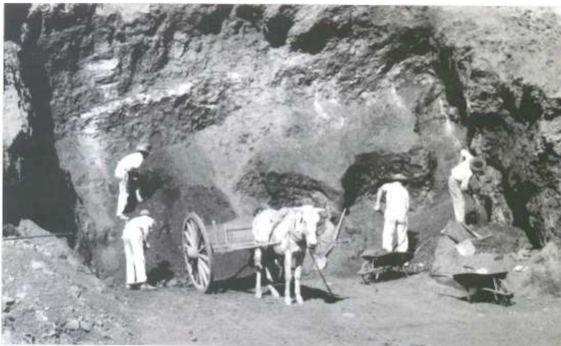
Figura 5: Primeiros trabalhadores da ICOMI, que desde então não trabalhavam em condições adequadas

Silva (2002, p. 63) comenta o caso retromencionado e traz algumas explicações técnicas sobre a contaminação dos mineiros pelo manganês: