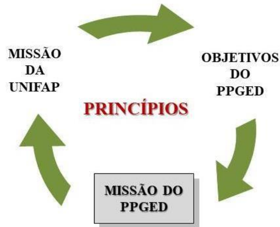
Figura 1. Construção da Missão do PPGED