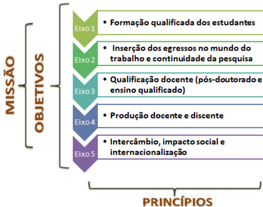
Figura 2. Articulação Princípios, Missão e Eixos Norteadores