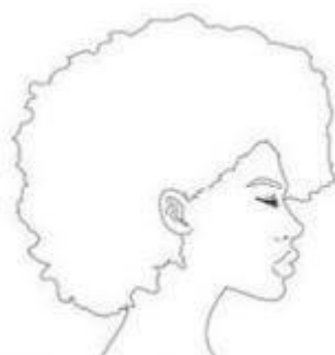
Foto3) FOTO DO SEU PERFIL ESQUERDO, DE ACORDO COM A IMAGEM ABAIXO. MAX 1MB

Foto2) FOTO DO SEU PERFIL DIREITO, DE ACORDO COM A IMAGEM ABAIXO. MAX 1MB